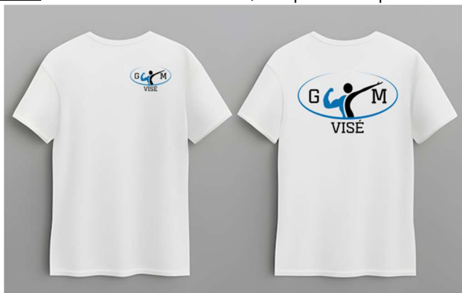
T-shirt : offert pour toute inscription avant octobre

Note : Liste non-exhaustive, les prix indiqués ont une valeur indicative