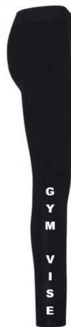
Legging : 18€

Maillot du club : une communication spécifique vous parviendra courant septembre.