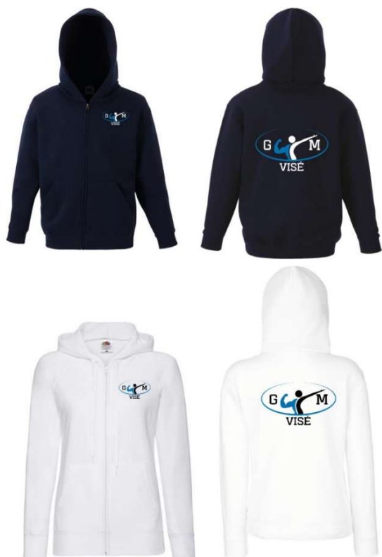
Pull bleu ou blanc : 30€